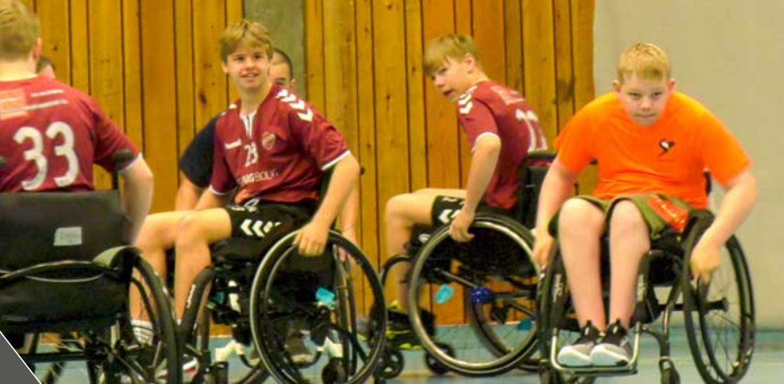
NIH-studenter får bryne seg mot spillere som bruker rullestol til hverdags. Camp Spinal på NIH

beredskapsøvelse med bistand fra eksterne konsulenter, hvor scenariet var personidentifiserbare forskningsdata og/eller andre typer personsensitive data på avveie. Øvelsen involverte IT avdelingen, personvernrådgiver, NIHs IRT team, kriseberedskapsledelsen og personer rundt om i organisasjonen som ble inndratt i håndteringen av situasjonen.