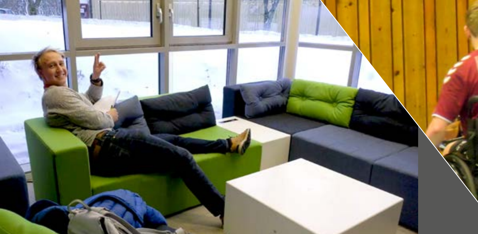
Studentene storkoser seg på nytt bibliotek.

forskningsresultater/annen sensitiv informasjon på avveie, sensitive data som lagres feil, uhell under forskningsforsøk (ulykker, blodsmitte, utmattelse) og ulykker som skjer i forbindelse med undervisning og praksis. Vi merker oss spesielt at studentenes mentale helse er fremtredende i samtlige institutters ROS-analyser. Dette er en endring fra forrige ROS-analyse.